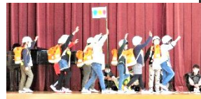
3年「スーパーモモタロウ」