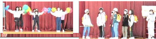
5年「6年生オリンピック!!」