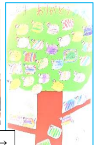
2年生ありがとうの木→